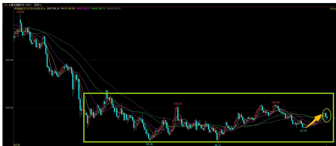
图 1 美元指数本周承压走弱

另一方面，美元指数整体保持偏弱局面，在经历了上周的反弹后，本周再度承压走低，这为贵金属的炒作提供了支撑